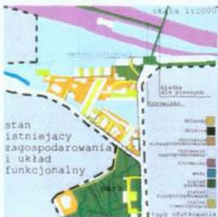
stan istniejący zagospodarowania i układ funkcjonalny