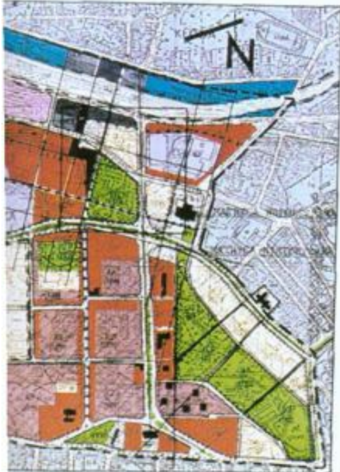
stan docelowy planu i strefowy planu

projekt dla obszaru w dzielnicy górnicy z terenem mieszkaniowym, przedsiębiorstwem usługowym i usługami, składową, placem, zielonym terenem rekreacyjnym, placem i parkingowym