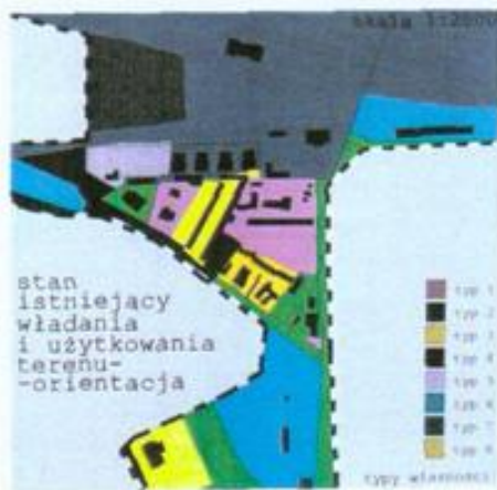
stan istniejący władania i użytkowania terenu-orientacja