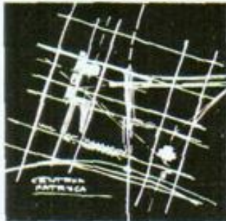
zapis terenowy i strefowy planu