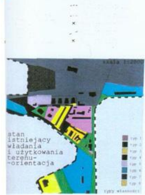
stan istniejący władania i użytkowania terenu- orientacja