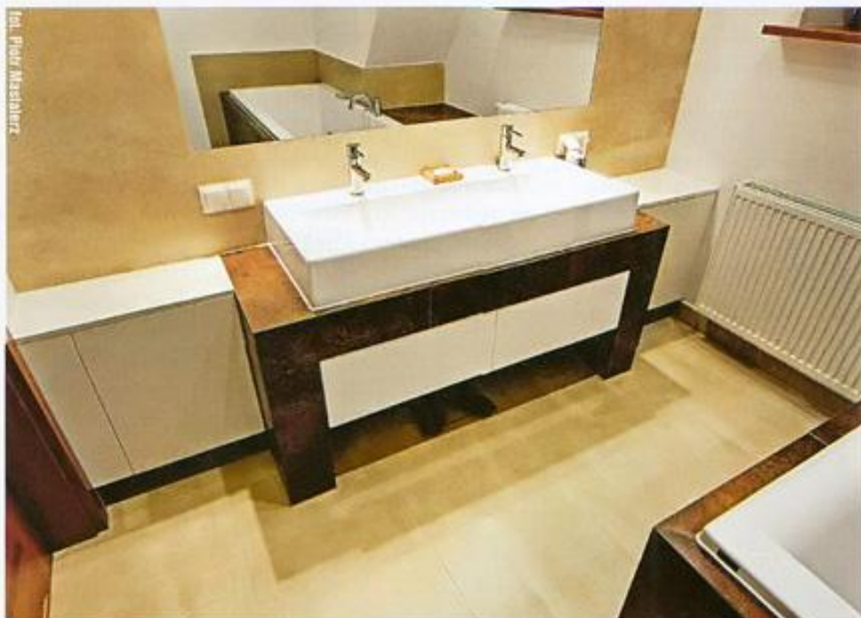
↑ Wszystkie elementy zabudowy łazienki wyglądają, jakby stanowiły jej stały element. Trudno się nawet domyślić, jak wiele miejsca na bibeloty mogą kryć

Okolice umywalki. Ogromny wybór umywalk montowanych do ściany i nablatowych pozwala zrezygnować z postumentu i w pełni wykorzystać przestrzeń pod umywalką. Jeżeli