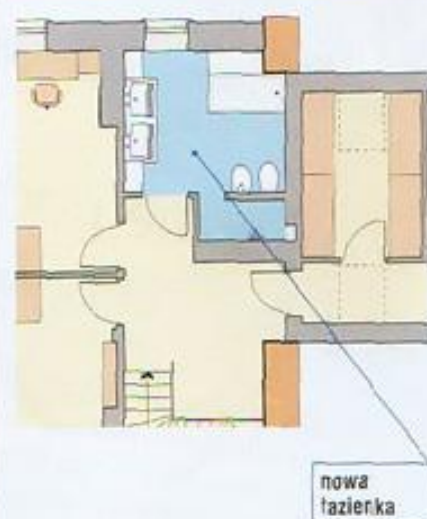
2 Poddasze z łazienką w obecnym kształcie

za tą ścianą ukryty jest prysznic. Część urządzeń (bidet, sedes prysznic i wanna) korzysta z pionu pozostałego po dawnym WC (w ścianie włączy prysznic).